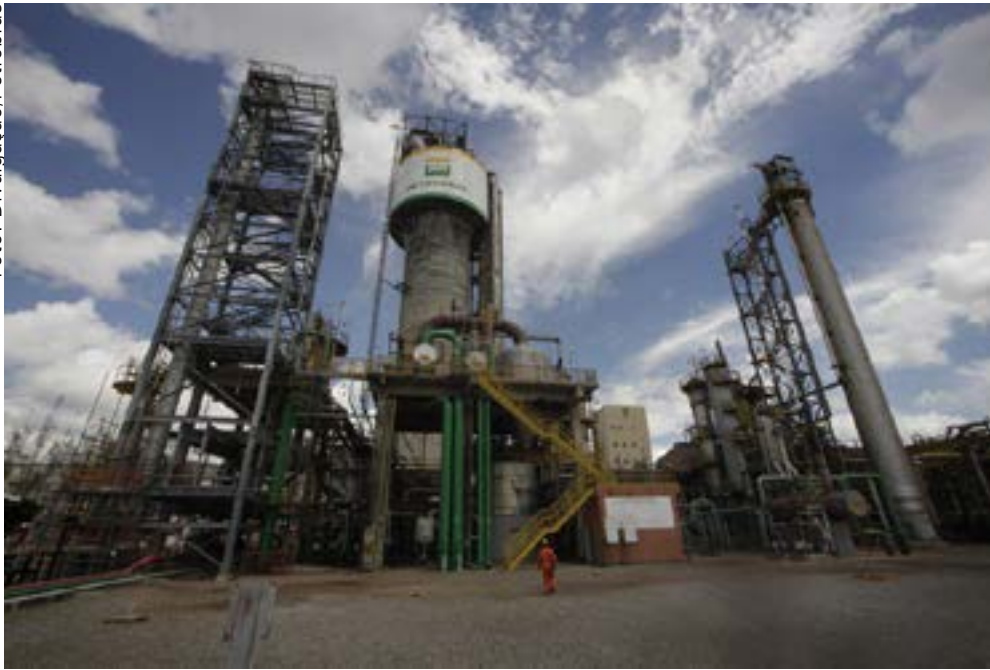
Fábrica de Fertilizantes Nitrogenados de Sergipe (FAFEN-SE)