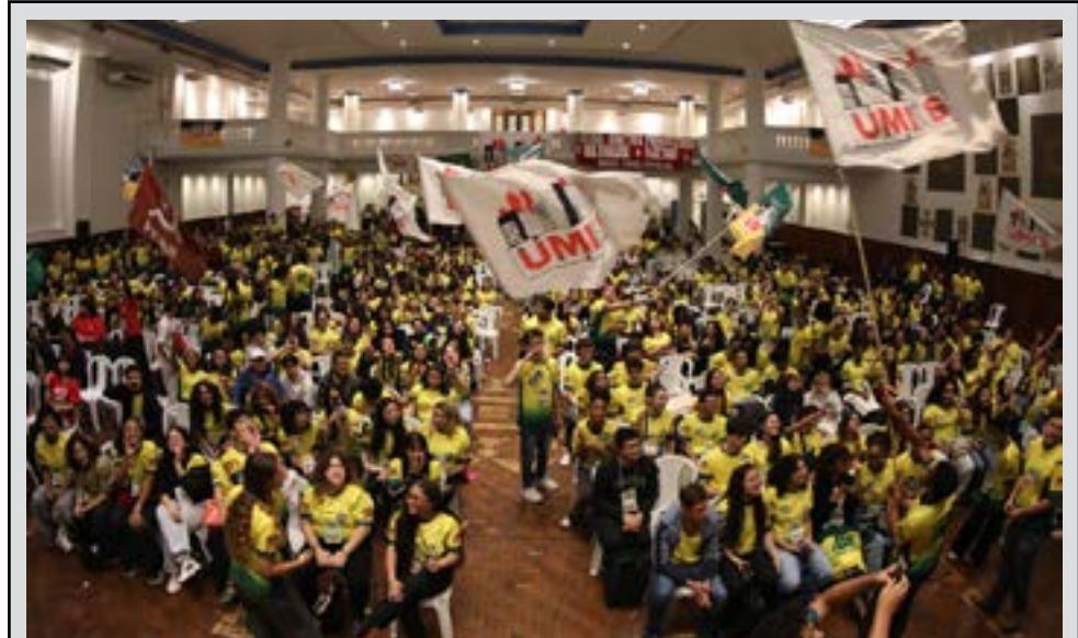
Mais de 900 estudantes de toda a capital participaram do congresso