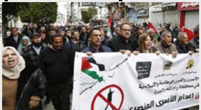
Verdugos almejam repetir a 'solução final' contra palestinos

ritório são automaticamente julgados em tribunais militares israelenses, a medida cria, na prática, uma via legal separada, discriminatória e a mais bárbara possível.