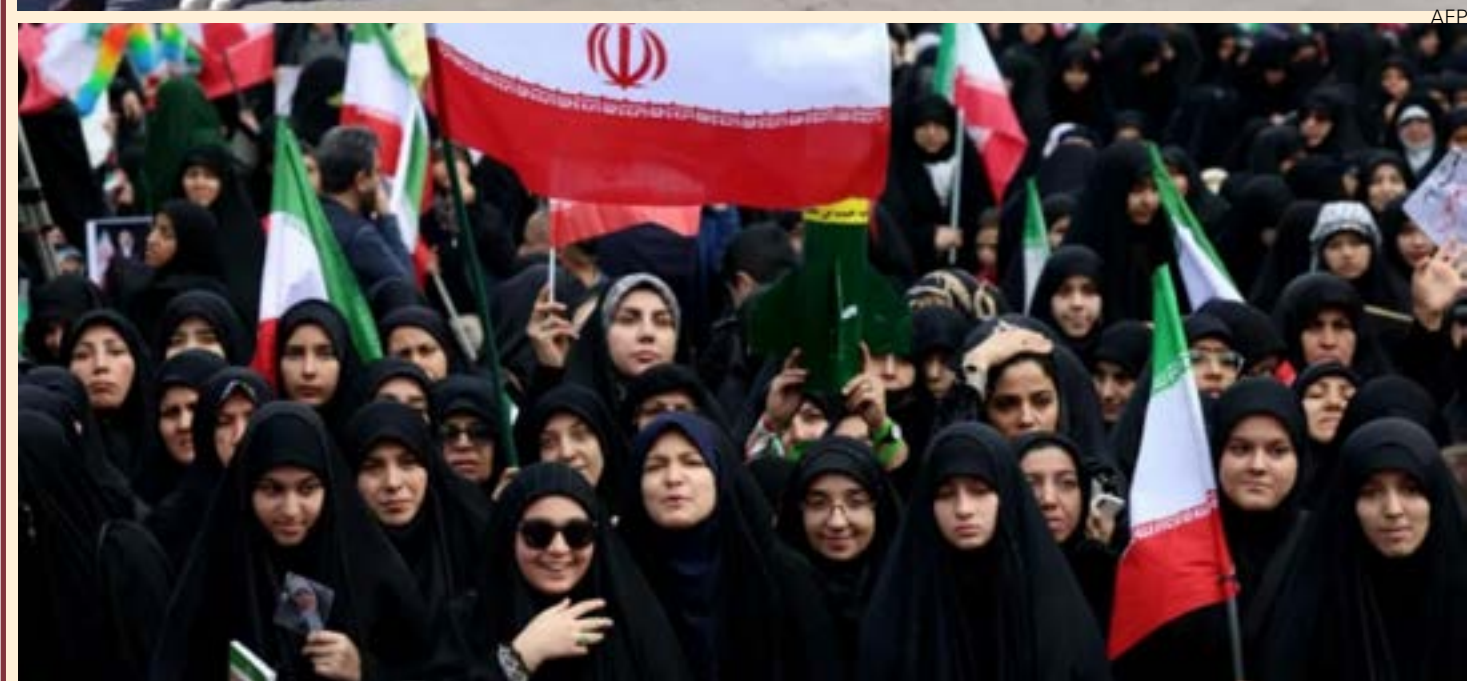
Ameaças de Trump provocaram uma maior unidade de iranianas e iranianos contra a dominação colonial

Povo faz corrente humana no Irã para defender usinas