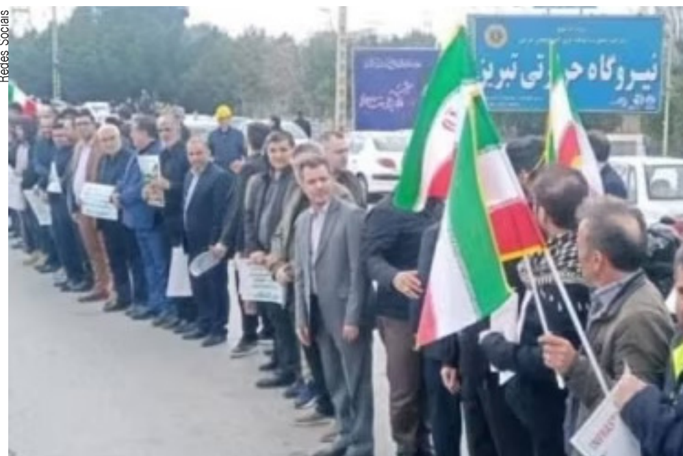
Correntes humanas demonstraram a imensa unidade iraniana