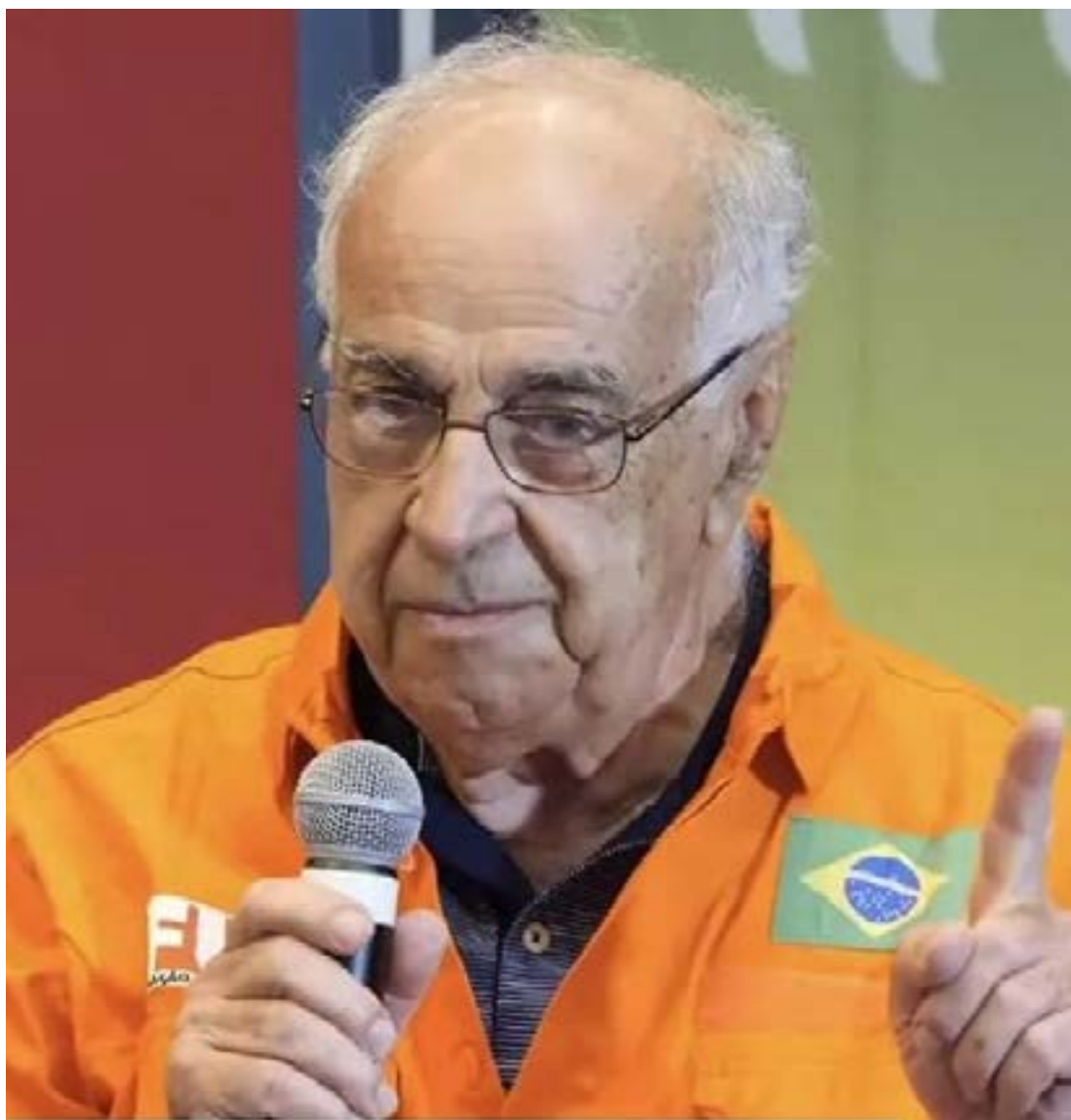
Guilherme Estrella, geólogo e ex-diretor da Petrobrás

Estrella: Com as mudanças a partir de 2016, isso foi alterado. Houve privatizações e mudanças na gestão das estatais, retirando do governo o controle direto. Então, com o golpe de 16, com a destituição da presidenta