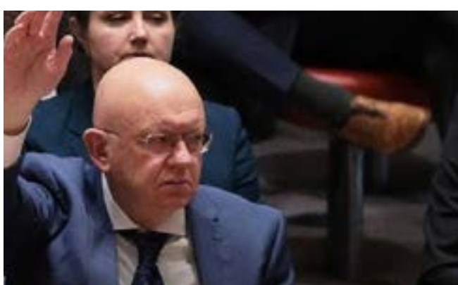
Embaixador Nebenzia, pela Rússia, afirma o veto à resolução de atacar iranianos em Ormuz

Até lembrou declaração da semana passada de Trump segundo o qual, uma vez que os combates cessassem, o estreito se reabriria normalmente. E essa é, portanto, a questão fundamental, deter a guerra. A França acabou endossan-