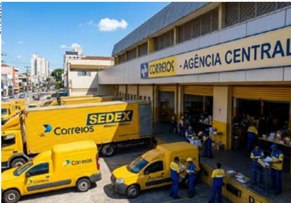
Sindicatos repudiaram plano da empresa de demitir 10 mil funcionários