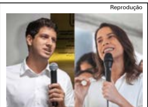
Ex-prefeito do Recife, João Campos e atual governadora Raquel Lyra

“A última gestão foi marcada por uma intensa luta, principalmente contra a precarização da escola estadual. Nós iniciamos a gestão com uma PEC que ia cortar mais de R$ 11 bilhões da educação. A UMES e os estudantes de São Paulo se mobilizaram e conseguiram adiar isso. E logo depois a gente fez intensas mobilizações a favor do ensino técnico e contra a precarização das escolas.