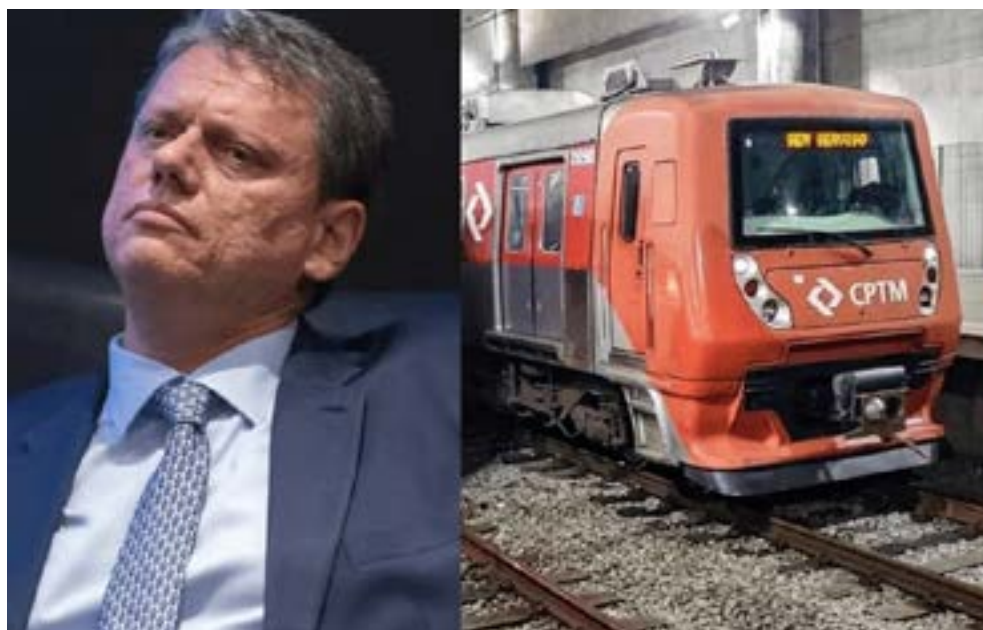
Enquanto desmonta CPTM, Tarcísio repassará R$ 10 bilhões para privatizadas