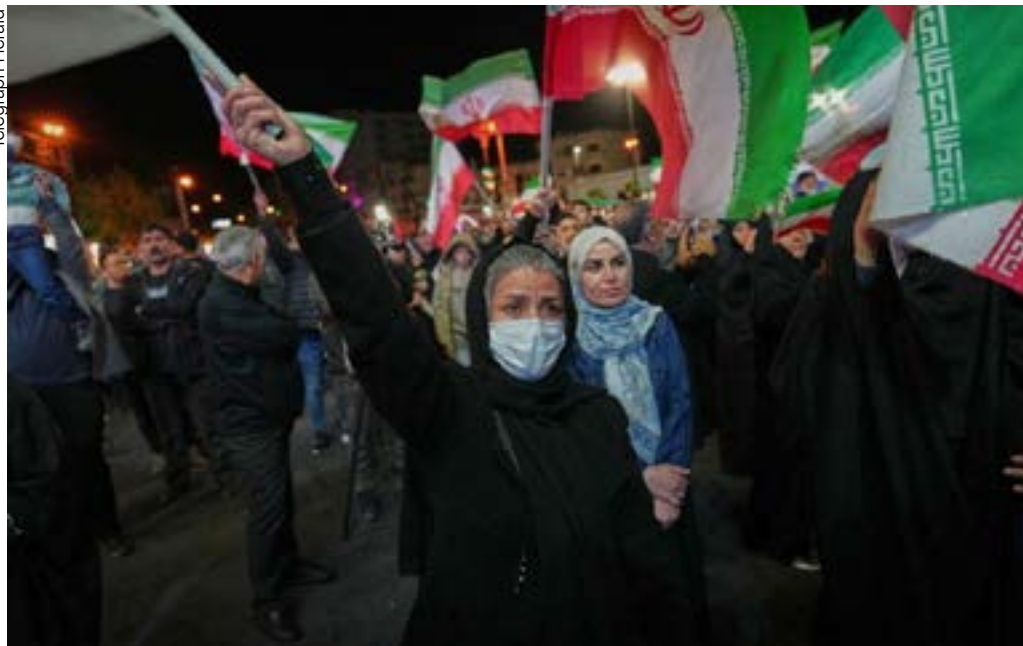
Unidade do povo iraniano foi decisiva para a vitória sobre a agressão de Trump