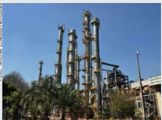
Fábrica de Fertilizantes Araucária Nitrogenados (ANSA), no Paraná reativada pelo presidente Lula

A Fábrica de Fertilizantes Nitrogenados de Sergipe