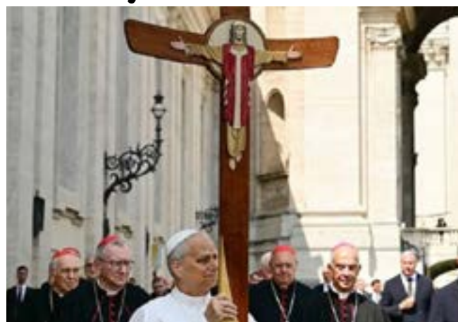
Papa Leão 14 carrega a cruz nas 14 estações da reprodução da Via Sacra no Coliseu

No discurso proferido na Praça de São Pedro, durante