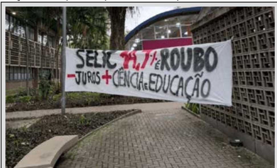
Grupo estendeu uma faixa no caminho por onde Galípolo passaria. Estudantes da USP protestam contra juros altos durante palestra de Galípolo: Selic 14,7% é roubo

Estudantes da Universidade de São Paulo (USP) realizaram um protesto nesta sexta-feira (10) contra a elevada taxa de juros na presença do presidente do Banco Central (BC), Gabriel Galípolo. O presidente do BC estava na Faculdade de Economia e Administração (FEA-USP), onde iria realizar uma palestra no local.