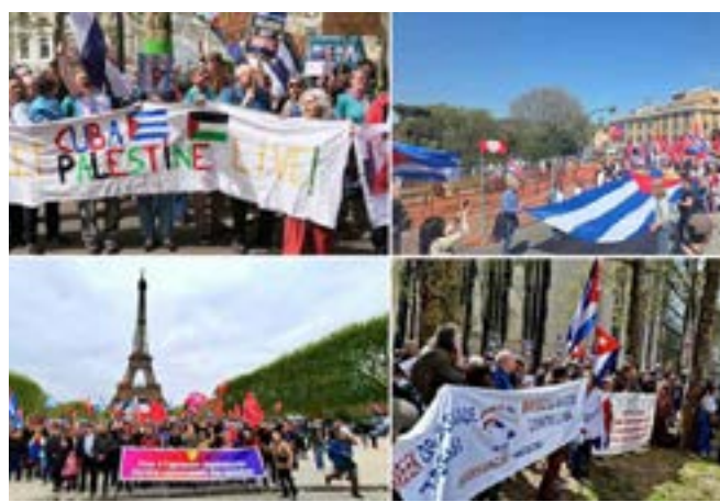
Manifestações em Roma, Paris e Bruxelas