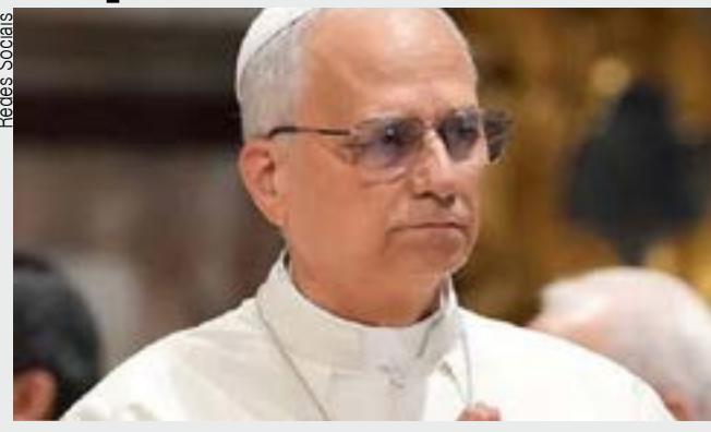
Papa declara que seguirá com sua pregação pela paz

“Colocar minha mensagem no mesmo patamar do que o presidente tentou fazer aqui, creio eu, é não compreender qual é a mensagem do Evangelho, e lamento ouvir isso, mas continuarei com o que acredito ser a missão da Igreja no mundo hoje. Não hesitarei em anunciar a mensagem do Evangelho e em convidar todas as pessoas a procurarem maneiras de construir pontes de paz e reconciliação, e a buscarmos formas de evitar a guerra sempre que possível”, disse Leão, que é o primeiro papa norte-americano.