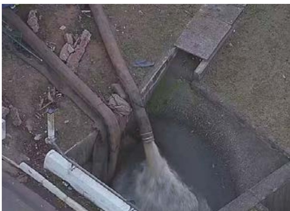
Sanções foram aplicadas após uma série de episódios entre 2025 e 2026

O levantamento também mediu a avaliação da atual gestão estadual, comandada por Eduardo Leite (PSDB). Os números mostram um cenário equilibrado: 48,2% dos entrevistados aprovam o governo, enquanto 47% desaprovam, indicando um ambiente político dividido que pode influenciar diretamente o comportamento do eleitorado na eleição.