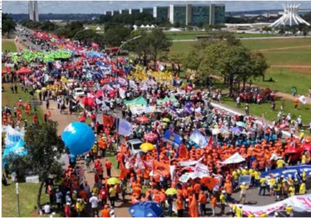
Entidades pedem mudança na jornada, redução dos juros e não à pejetização

Atualmente, cerca de 37,2 milhões de trabalhadores têm jornadas acima de 40 horas semanais, o equivalente a aproximadamente 74% dos celetistas. E cerca de 14 milhões de brasileiros trabalham na escala 6x1, com apenas um dia de descanso. Além disso, 26,3 milhões de celetistas não recebem horas extras, o que indica jornadas frequentemente mais longas na prática. sofre com a síndrome de Burnout. Esta é a principal razão para a baixa produtividade do trabalho no Brasil.