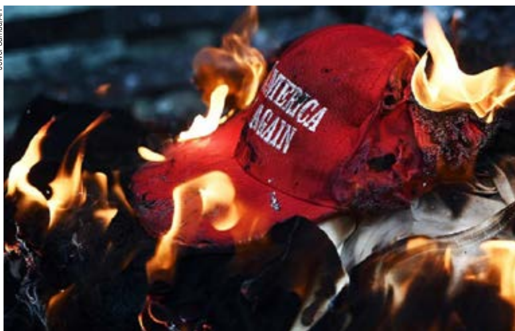
Adeptos rebeldes fazem questão de divulgar a queima do símbolo trumpista