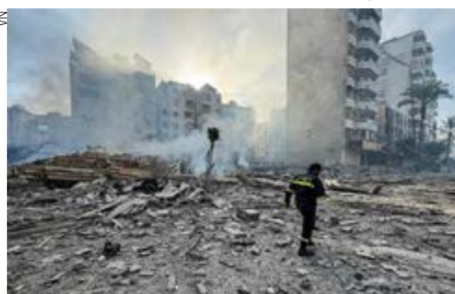
Devastação com o bombardeio a Beirute

“Apelo às partes em conflito para que cessem o fogo e busquem com urgência uma solução pacífica”, atitude que