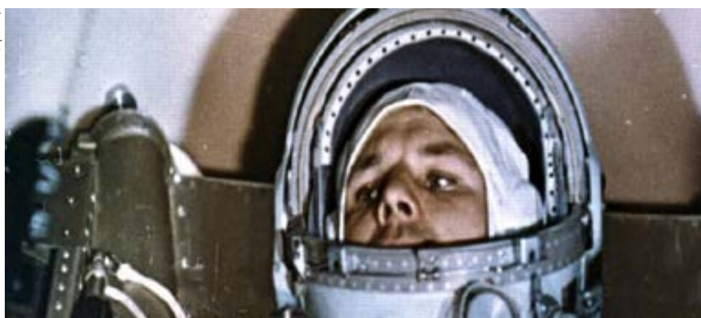
Yuri Gagarin na Vostok1 pouco antes do lançamento no cosmódromo de Baikonur