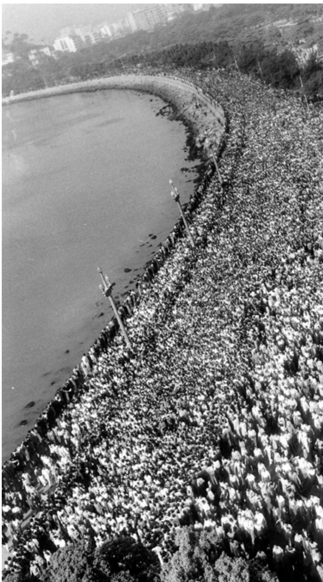
Getúlio Vargas e, ao lado, multidão acompanha o cortejo fúnebre do presidente, em 1954

Vargas que possam ilustrar sua vida e seus feitos, nada será mais modelar do que sua carta-testamento. É impressionante como, 59 anos depois, ela continua perfeitamente atual. A algumas horas do gesto que marcou – e marca até hoje – a vida política brasileira, elevada naquele momento, e através dele, a uma altura quase única de dignidade e heroísmo, Getúlio fez a síntese de sua obra, formulou o legado que deixaria ao povo e à Nação, ponderou a importância desse legado para o futuro e definiu, com precisão, os inimigos do nosso desenvolvimento e de nossa independência que era necessário derrotar.