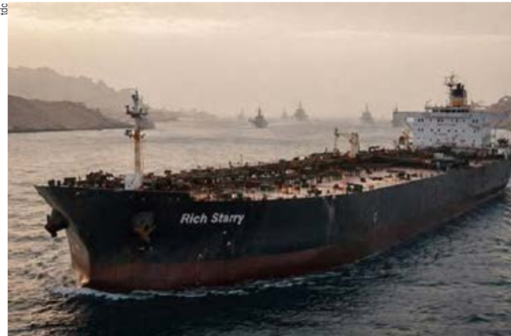
Navio chinês Rich Starry fura bloqueio trumpista e atravessa Ormuz

O petroleiro chinês Rich Starry atravessou o Estreito de Ormuz, vencendo bloqueio naval dos EUA. A travessia do primeiro barco a sair do Golfo Pérsico ocorreu logo depois do início da vigência da medida anunciada por Trump