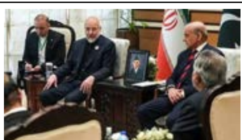
Delegação do Irã é recebida pelo premiê paquistanês Sharif