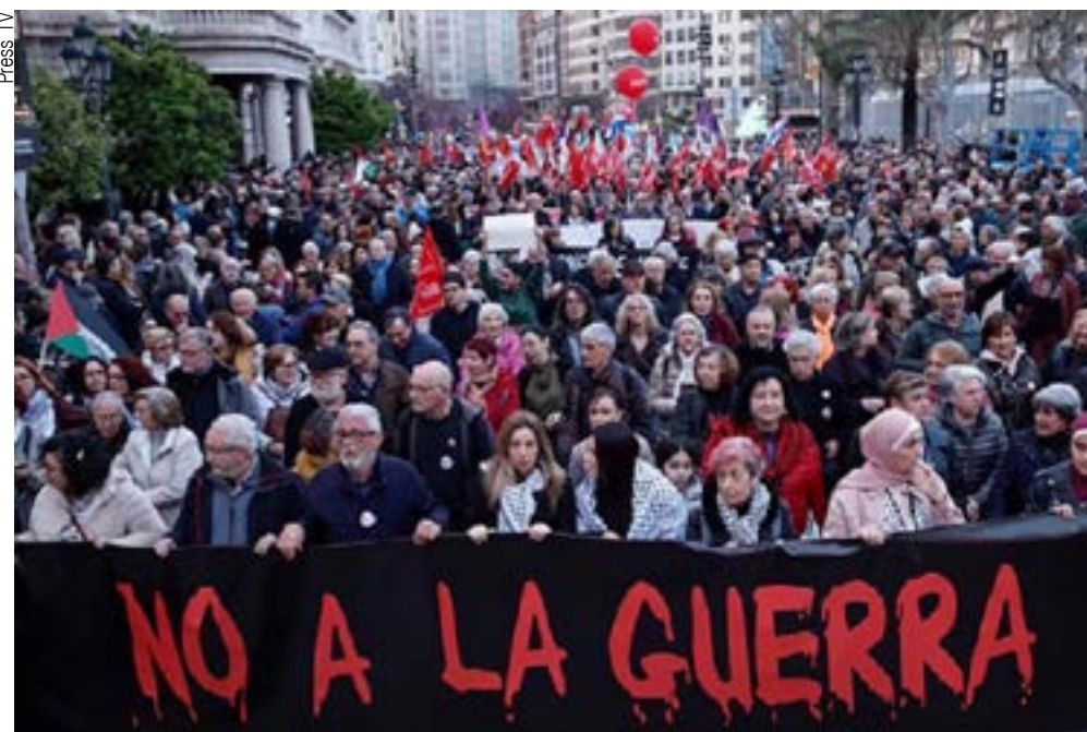
Manifestações como esta, em Valencia, se repetiram por toda Espanha

Teerã advertiu que não negociará sob ameaças,