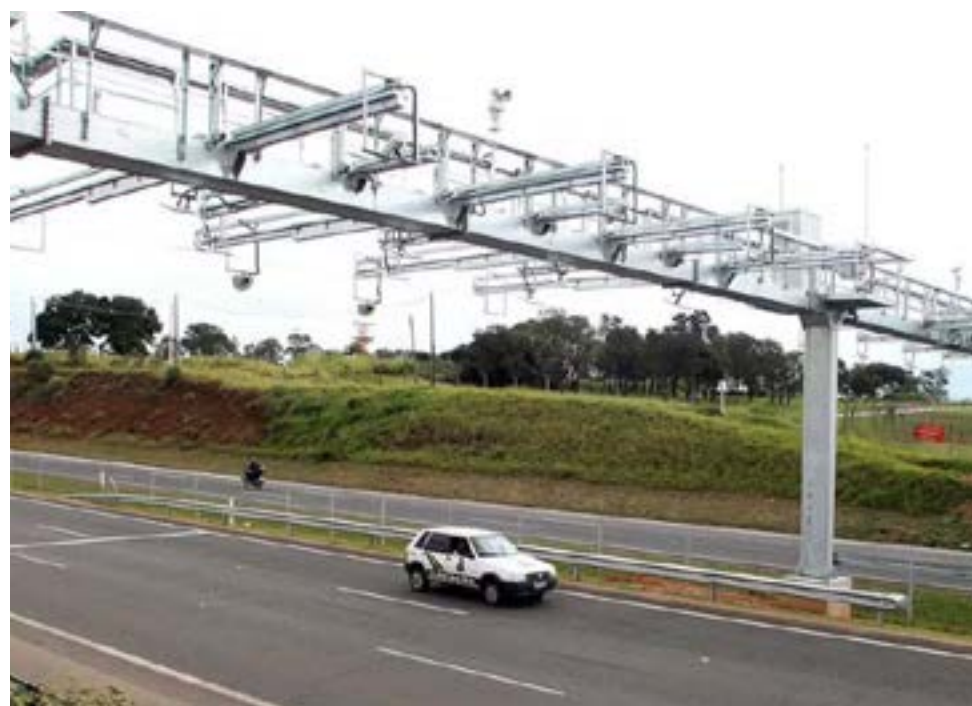
"A tecnologia não pode trazer prejuízo ao cidadão", destaca o governo

Os partidos afirmam que o perfil foi concebido como instrumento político disfarçado. Em trecho da representação, destacam: "Se trata