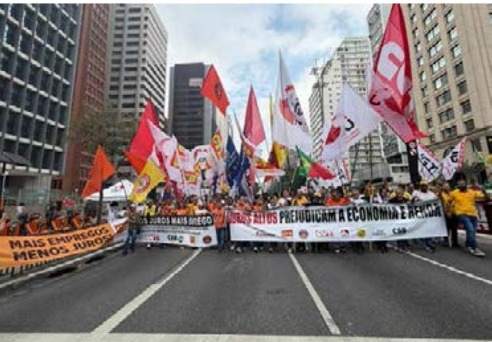
Protesto das centrais em frente ao Banco Central, em SP, exigiu a queda dos juros