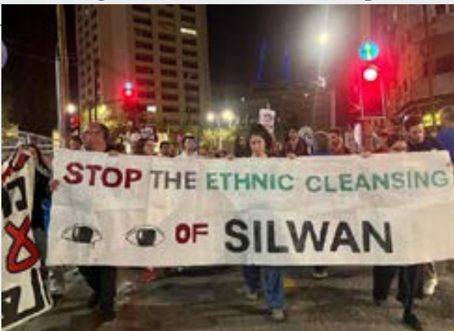
"Parem a limpeza étnica", exige faixa em Jerusalém

Enquanto os manifestantes marchavam em direção à praça Habima, ecoava o brado