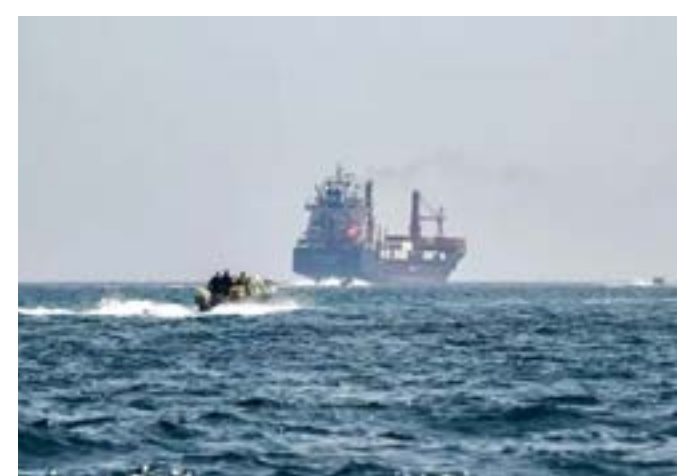
Estreito de Ormuz sob controle iraniano

“Ele teve alguns conflitos com outras pessoas, principalmente sobre a construção e compra de novos navios. Sou muito agressivo na construção de novos navios, e de alguma forma ele simplesmente não se dava bem com eles. Ele é um cara excelente. Acho que ele teria se dado muito bem comigo. Eu realmente não lidei muito com ele”, disse o presidente aos repórteres na Casa Branca.