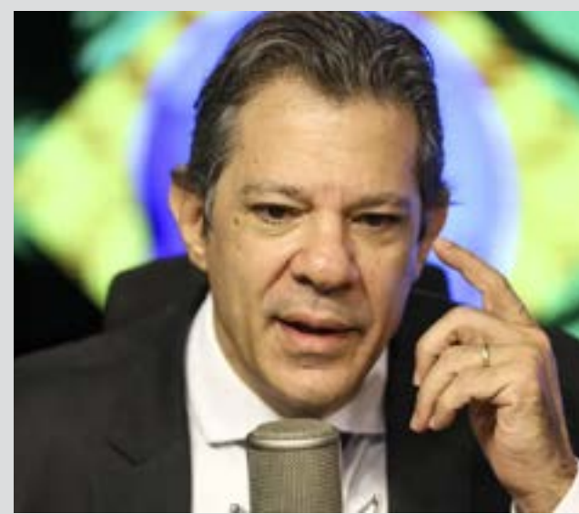
Ex-ministro do governo Lula, Fernando Haddad

Haddad, em gravação publicada em suas redes sociais, detalhou sua reação e questionou a atuação do governo estadual diante das denúncias. "Eu queria falar com vocês sobre um episódio recente na área da Segurança Pública. Escolher quem vai comandar a polícia é uma grande responsabilidade. E acho que você concorda que não basta olhar critérios técnicos apenas. E preciso conhecer bem o caráter de quem será nomeado, porque se trata de um cargo de alta confiança. É no governador ou gover-