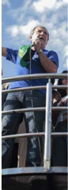
Silas Malafaia em ato