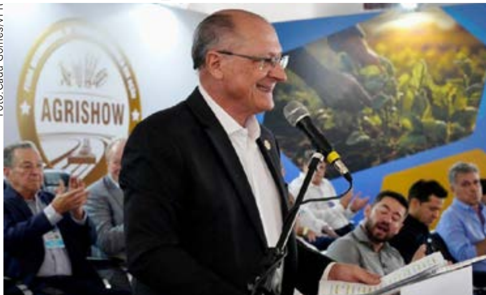
Vice-presidente da República, Geraldo Alckmin, na abertura do Agrishow