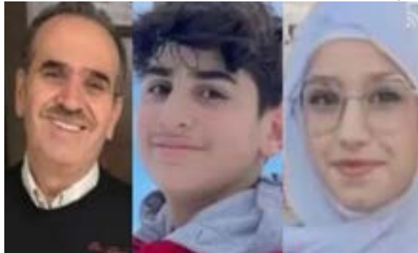
Pai libanês, filho e mãe brasileiros mortos