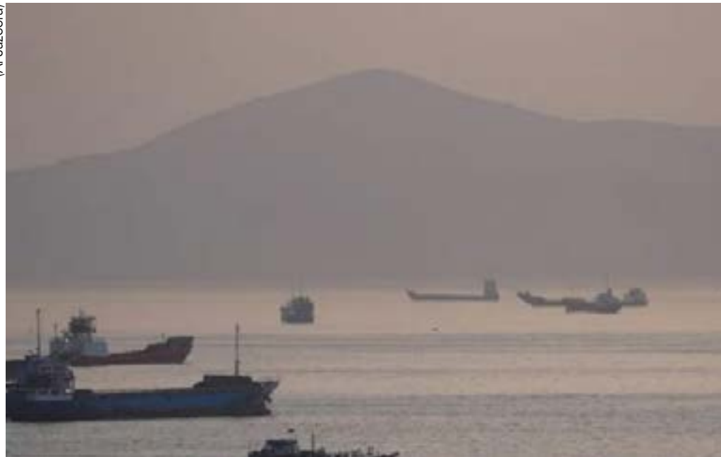
Navios aguardam o fim da intransigência de Trump para que Ormuz volte a ser livre