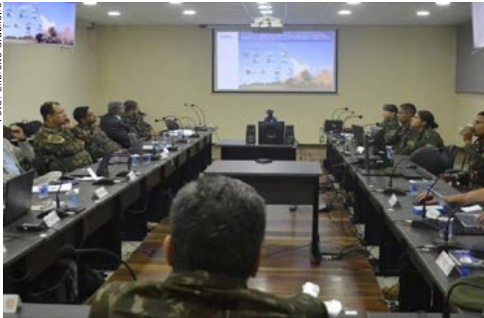
Participaram da reunião altas autoridades militares e diretores da Avibrás