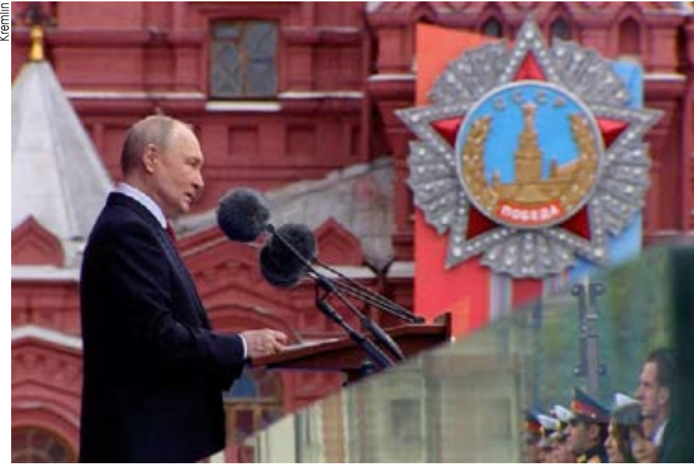
“A vitória sempre será nossa”, enfatiza Putin na Praça Vermelha