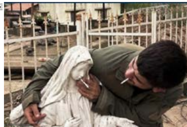
Soldado de Netanyahu ao profanar a estátua

Em um ato de deboche ao clamor contra a profanação, no sul do Líbano invadido, de uma estátua do Cristo crucificado, cometida com uma marreta por um soldado de Israel, o autor e o fotógrafo do vandalismo foram agracia-