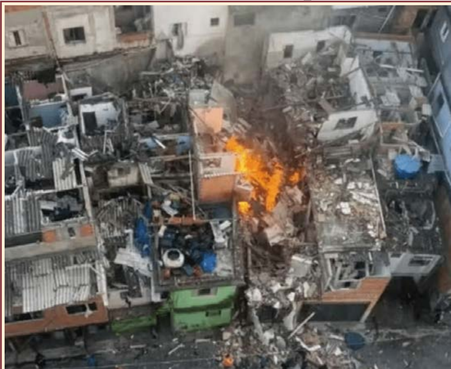
A barbearagem da privatizada matou um homem, deixou feridos, destruiu casas e desalojou 160 moradores