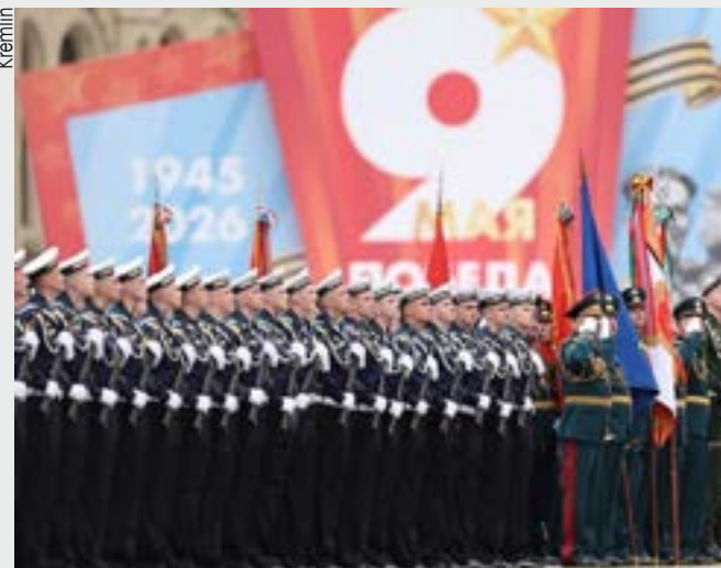
Vitória é comemorada com parada na Praça Vermelha

Nas batalhas de Moscou e Stalingrado, Orel e Belgorod, o valente Exército Vermelho quebrou a espinha dorsal da besta hitlerista. Kiev e Minsk, Odessa e Sebastopol, Varsóvia e Praga, Viena e Belgrado foram libertadas da crosta marrom. As armas de nossos heróis vitoriosos foram