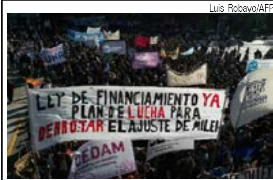
Estudantes protestam contra cortes de Milei