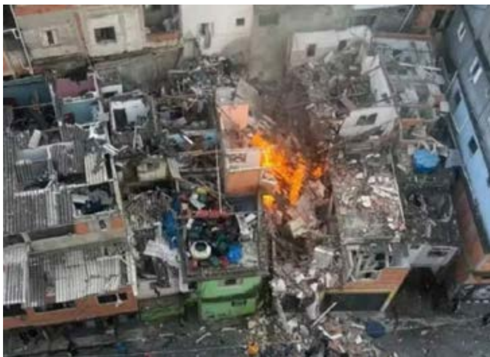
Sindicato denuncia série de mortes após privatização da Sabesp por Tarcísio