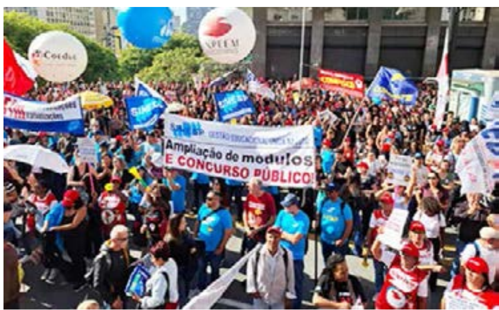
Assembleia dos servidores da Educação. Na foto acima, o profssot Claudio Fonseca