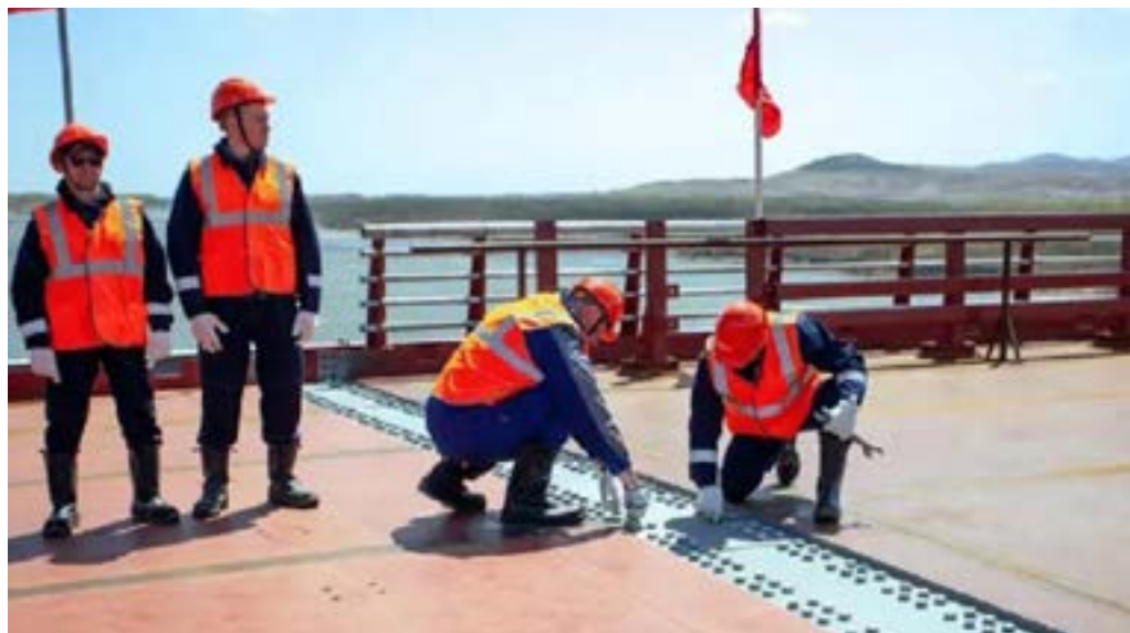
Ponte que unirá Rússia e Coreia socialista em fase final de construção