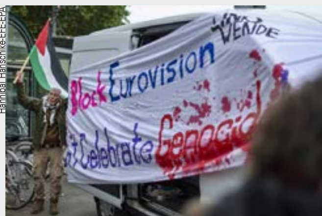
Manifestantes em Viena denunciam genocídio de Israel

Enquanto as agências de notícias mostram que os pogroms contra palestinos cometidos por bandidos supremacistas judeus estão se multiplicando na Cisjordânia ocupada, pela primeira vez uma reunião de ministros das Relações Exteriores da