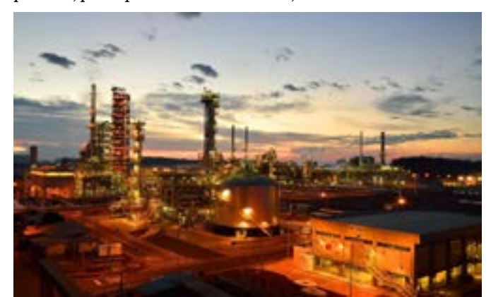
Refinaria de Paulínia (Replan).