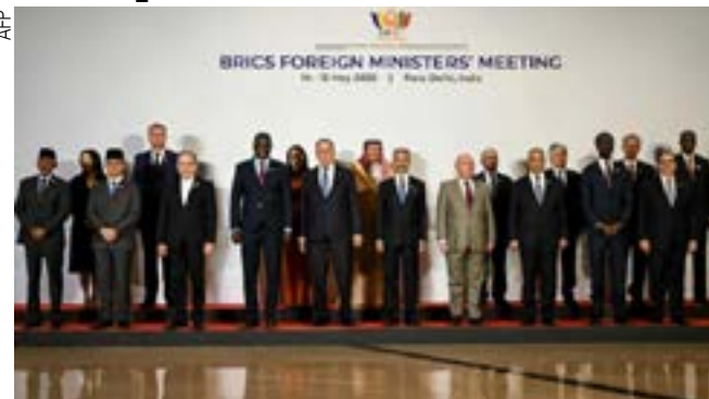
Declarações da Rússia e China se deram durante a reunião dos ministros do Exterior do BRICS na Índia

Em comunicado divulgado na sexta-feira pelo Ministério das Relações Exteriores, a China também denunciou o