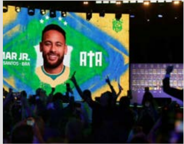
Lista de convocados foi anunciada no dia 18

Atacantes: Endrick (Lyon), Gabriel Martinelli (Arsenal), Igor Thiago (Brentford), Luiz Henrique (Zenit), Mathues Cunha (Manchester United), Neymar (Santos), Rayan (Bournemouth), Vinicius Júnior (Real Madrid) e Raphinha