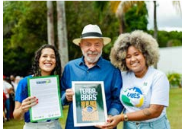
Presidentes da UNE e UBES entregaram o manifesto dos estudantes ao presidente Lula

“O movimento estudantil cumpre o seu papel histórico de formular e tensionar os rumos do país. Seguiremos vigilantes e em diálogo, cobrando que o governo federal assuma o compromisso com