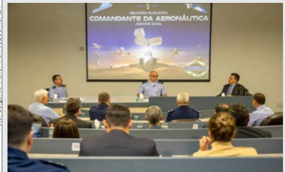
Comandante da Aeronáutica na ABIMDE: prioridade à indústria nacional