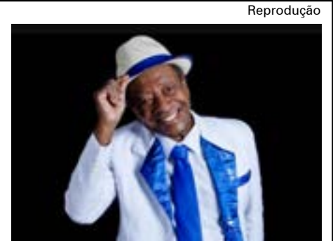
Cantor de 93 anos faleceu por complicações de uma pneumonia

Entre as propostas apresentadas no manifesto estão a criação de um fundo soberano nacional, investimento público em ciência e tecnologia, fortalecimento das universidades e limites à participação estrangeira no setor.