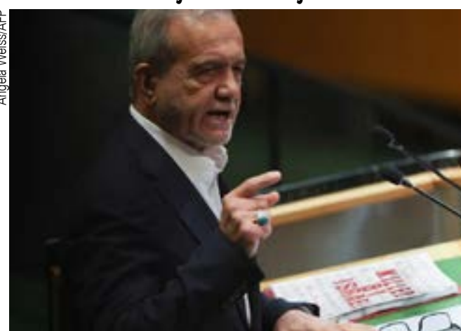
Presidente do Irã, Massoud Pezeshkian

O presidente iraniano lembrou também que os americanos e israelenses assassinaram o líder da Revolução Islâmica, o aiatolá Seyyed