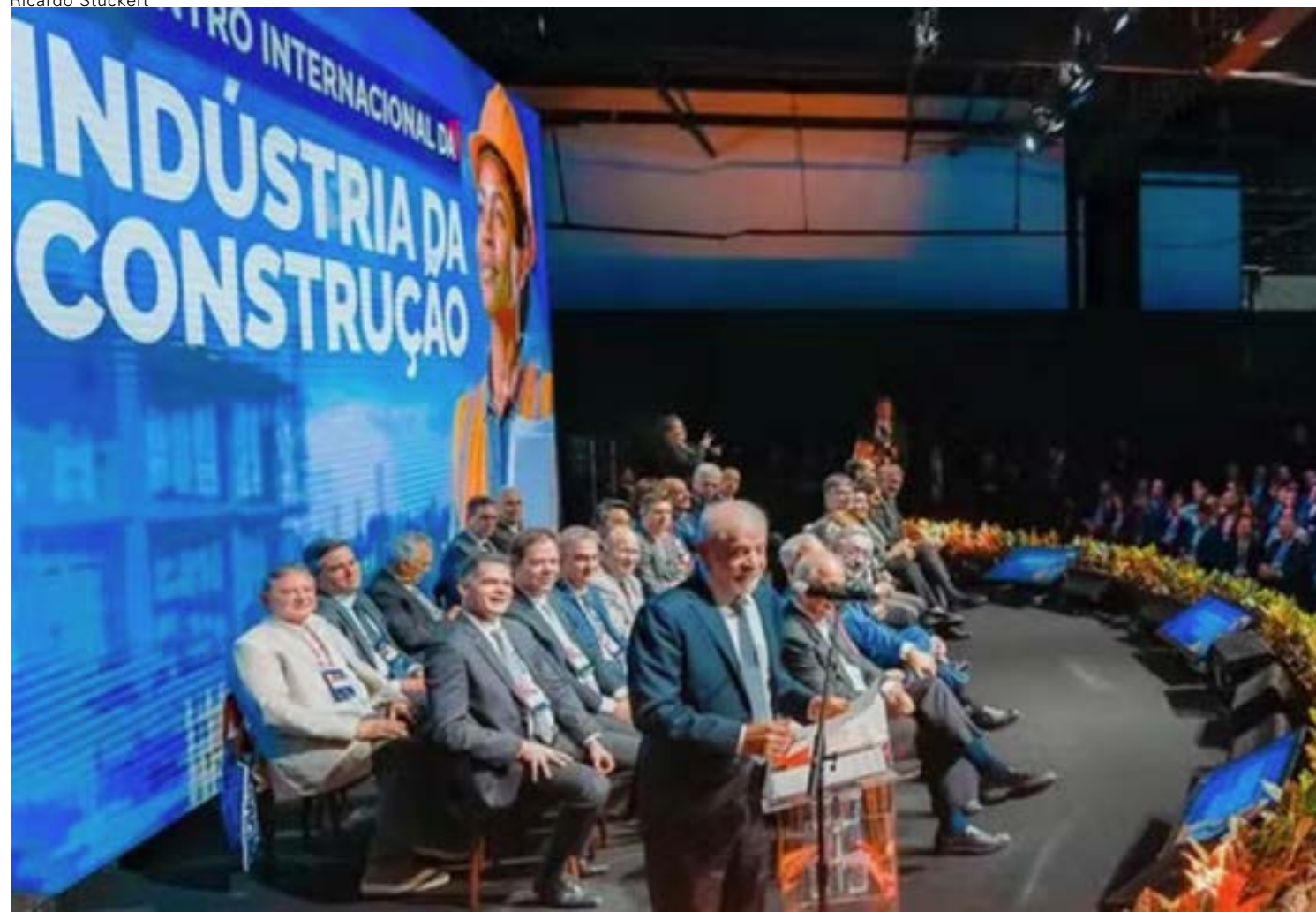
"Hoje o povo quer mais tempo pra ficar em casa, pra lazer, pra estudar, pra namorar", afirmou o presidente

O presidente Lula afirmou na terça-feira (19) que o fim da escala de trabalho 6x1 é uma "coisa necessária". A declaração foi feita durante a abertura de um evento internacional da indústria da construção civil, diante de empresários do setor, em São Paulo. Lula argumentou que a redução da jornada de trabalho acompanha mudanças no comportamento da sociedade e a busca por mais tempo livre. "Não fiquem assustados. O fim da escala 6x1 é uma coisa necessária, porque hoje o povo quer mais tempo pra ficar em casa, pra lazer, pra estudar, pra namorar", afirmou. Pág. 3