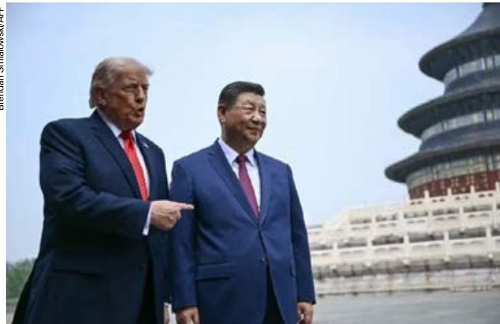
Xi Jinping recebe Trump em Pequim com tapete vermelho e declarações firmes