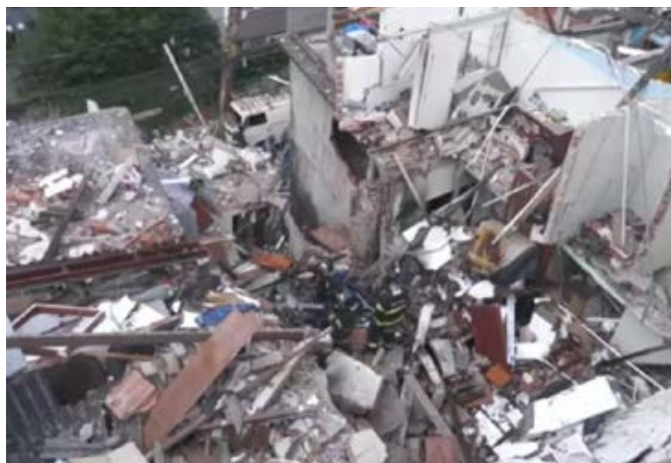
“Equatorial está realmente colocando o nome Sabesp na lata do lixo da forma como está atuando hoje”. Na foto, explosão no Jaguaré que matou 2 pessoas