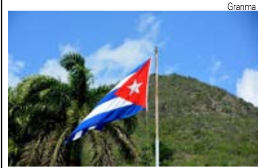
Cuba alerta para graves consequências à AL

Com o fechamento do Estreito de Ormuz pelos iranianos e a avalanche de reprovção nos EUA contra guerra, o governo americano, acuado, teve que aceitar um cessar-fogo em 8 de abril, mediado pelo Paquistão, mas mesmo assim se mantém a desconfiança contra as intenções dos americanos e dos israelenses, que nunca respitam acordo algum. Não há acordo para fim do conflito devido à recusa de Trump em desistir de exigências que o Irã considera descabidas.