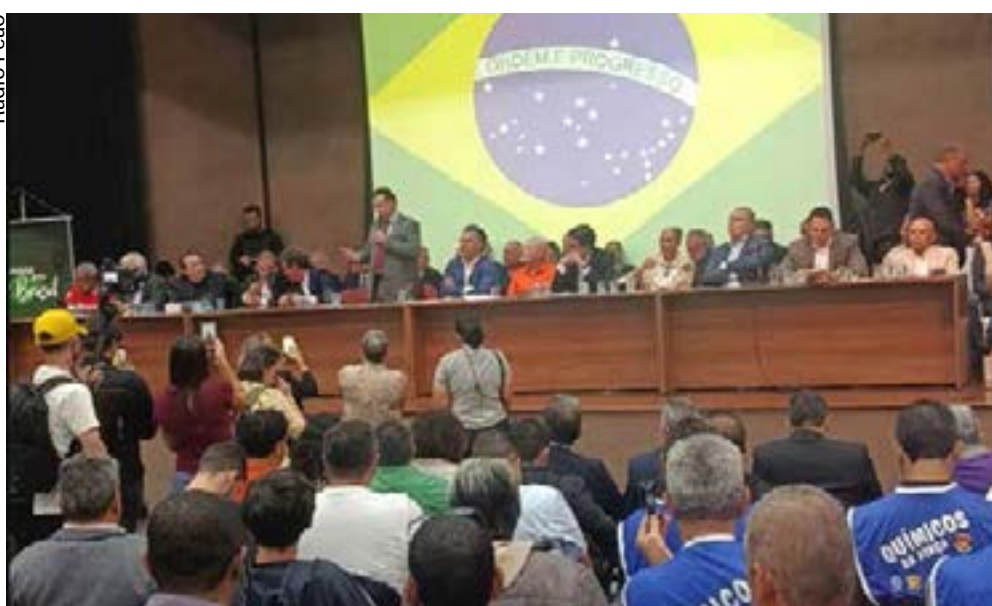
Seminário das Centrais Sindicais debateu mobilização pela redução da jornada