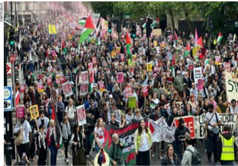
A manifestação londrina marcou o 78º aniversário da Nakba