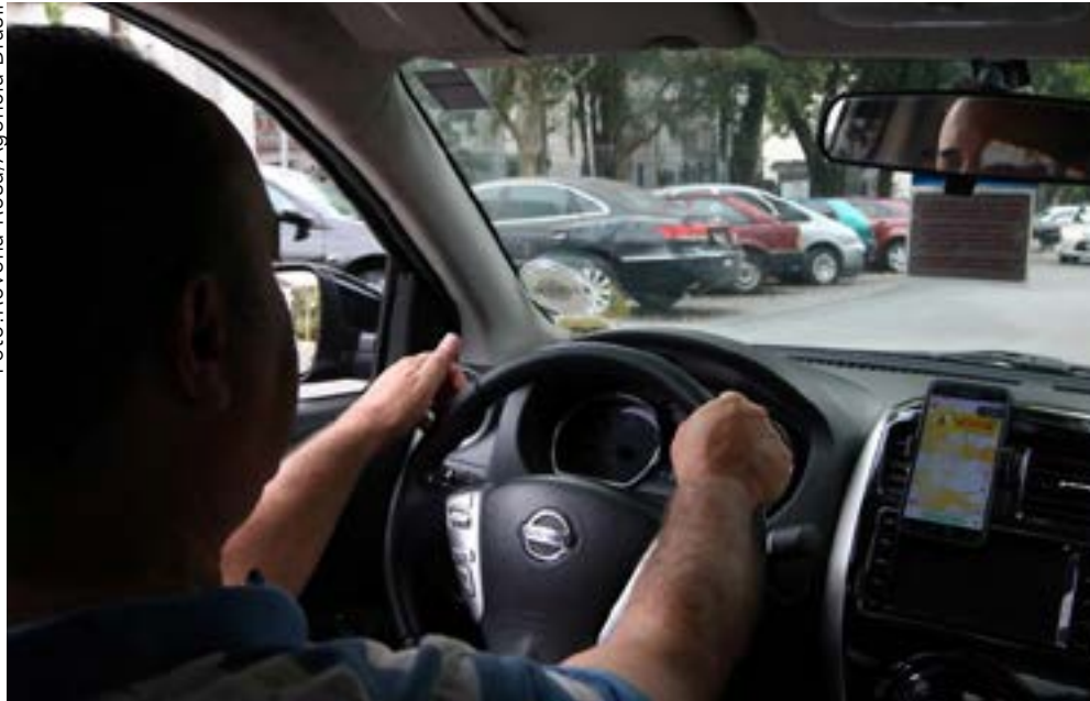
Programa do governo terá juros mais baixos e carência de seis meses