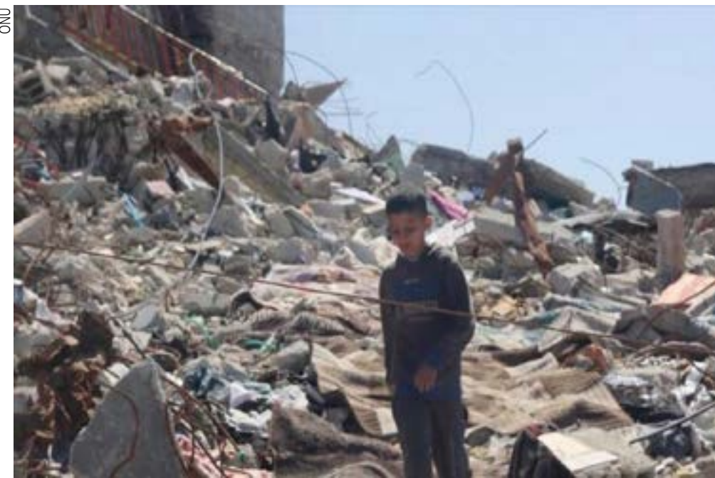
Durante o Eid al-Adha, principal data islâmica, Israel intensificou o morticínio