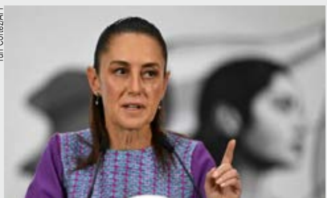
Sheinbaum decretou a deportação dos agentes da CIA

Mas a presença dos agentes foi autorizada, ilegalmente, pelo governo local de Chihuahua, de Maru Campos, do Partido da Ação Nacional, que faz oposição ao governo de Sheinbaum. A autorização dada pela governadora é ilegal por burlar a competência do governo federal, e Campos