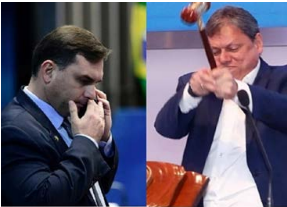
Flávio Bolsonaro e Tarcísio de Freitas negociaram com grupo de Vorcaro