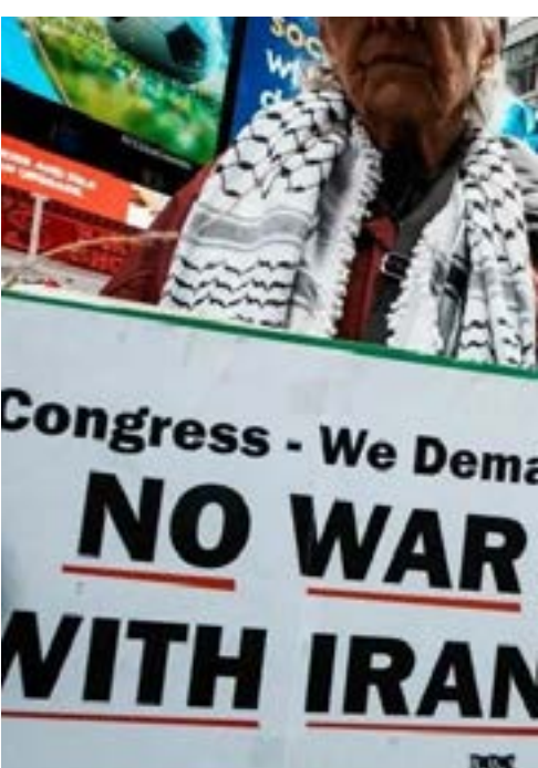
Protesto em Nova Iorque contra a guerra de Trump ao Irã.

A votação de terça-feira (19), com 50 votos a favor e 47 contra, contando com o apoio da maioria dos democratas e de quatro senadores republicanos, marca a primeira vez que a câmara aprovou o projeto de lei, sendo esta a oitava tentativa desde o início do conflito.