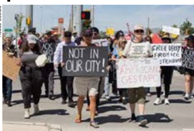
Protesto contra a agressão da “Gestapo americana”

Em fevereiro, uma inspeção determinada pelo Congresso americano norte-americano, diante da repercussão do caso, identificou