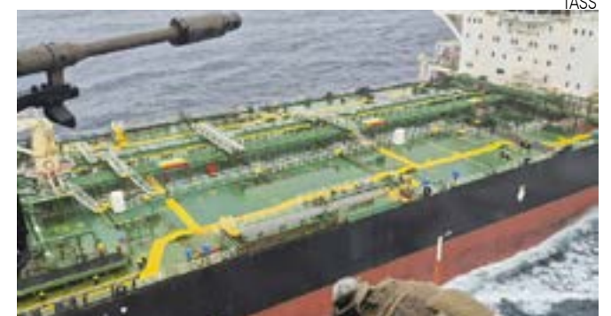
O petroleiro no momento do assalto francês

Israel violou o cessar-fogo que entrou em vigor em outubro mais de 3.000 vezes, matando centenas de pessoas e bloqueando a entrada de ajuda humanitária essencial. 929 palestinos foram mortos e 2.786 ficaram feridos, segundo o Ministério da Saúde de Gaza.