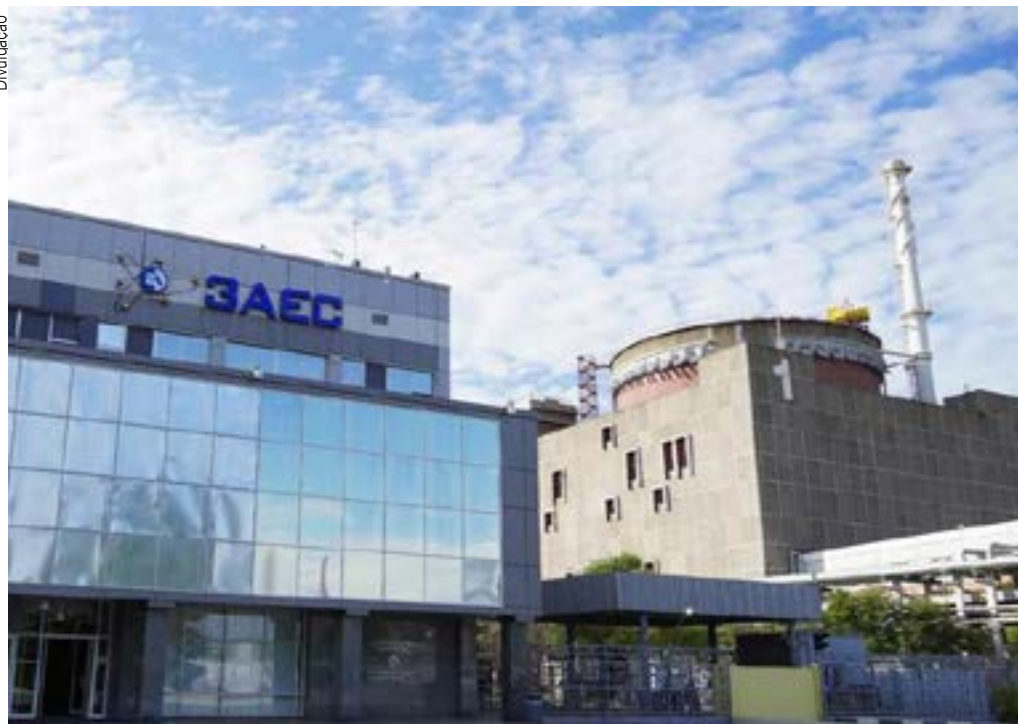
"O primeiro ataque deliberado contra uma usina nuclear", diz a estatal russa Rosatom