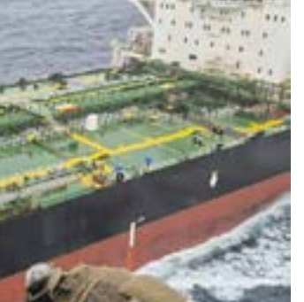
O petroleiro no momento do assalto francês