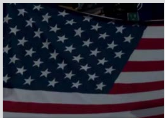
Coro ocorreu durante a execução do hino dos EUA

O coro da torcida brasileira encheu de orgulho àqueles que se opõem às ameaças de Trump contra a soberania brasileira. Vídeos que circulam nas redes sociais mostram torcedores gritando palavras de protesto contra o mandatário norte-americano, em um episódio que rapidamente repercutiu na internet.