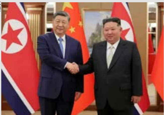
Líder coreano Kim Jong un recebe dirigente chinês Xi

“Este ano marca o 65º aniversário do Tratado de Amizade, Cooperação e Assistência Mútua China-RPDC e as relações entre os dois países encontram-se em um novo ponto de partida histórico”, afirmou Xi durante o banquete de boas vindas oferecido por Kim Jong Un, segundo a agência Xinhua. “A partir da perspectiva estratégica do futuro e do destino do socialismo, ambos os líderes concordaram em