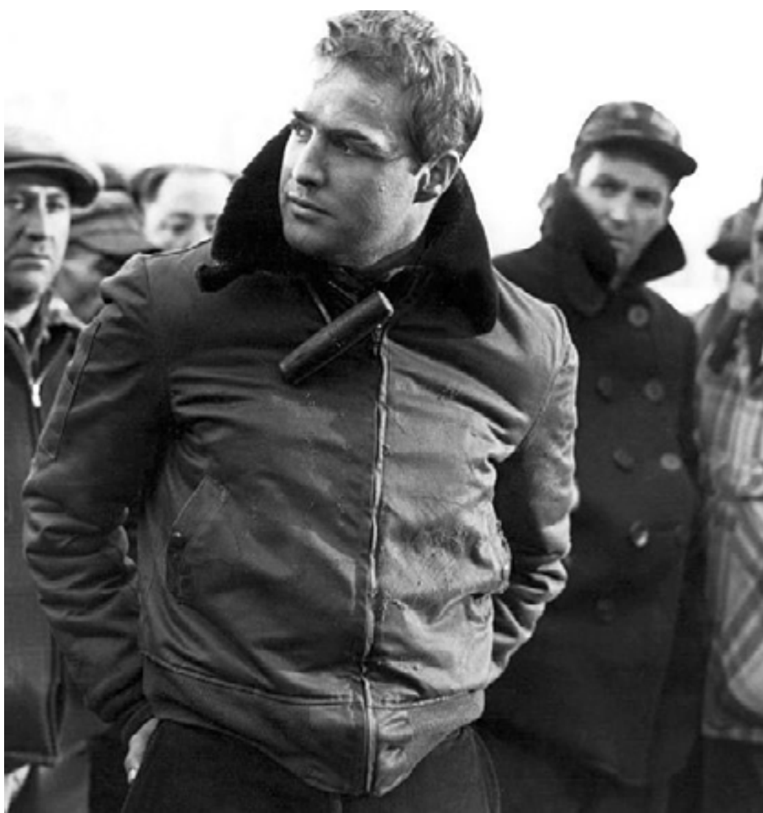
Marlon Brando em “Sindicato de Ladrões”, filme de Elia Kazan

O caso mais conhecido entre os delatados foi o de