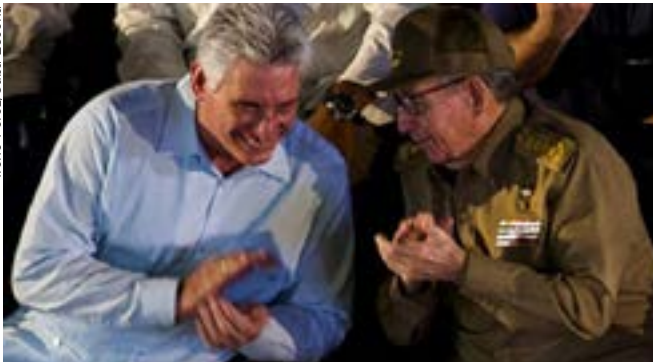
Díaz-Canel felicita Raúl Castro por seu aniversário

“Viva Cuba livre!, grita o povo das arquibancadas, convocado a