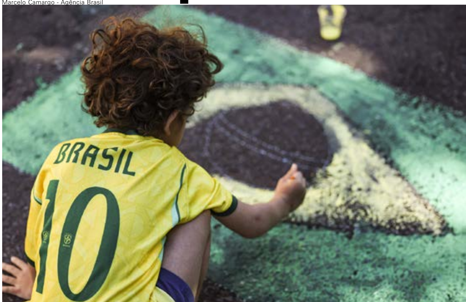
Marcelo Camargo - Agência Brasil

A torcida resolveu entrar em campo! Enquanto o técnico Carlo Ancelotti ainda tem dúvidas sobre a escalação da Seleção, nas ruas do Brasil o torcedor entrou com toda a certeza no jogo: camisa da Seleção, rua decorada, telões sendo armados, e aquela ansiedade no ar, das horas que não passam, até a estreia no sábado contra o Marrocos. Às vésperas da Copa do Mundo de 2026, uma tradição se mantém em diferentes cidades e bairros do Brasil: a pintura de ruas com o verde e amarelo. Página 4