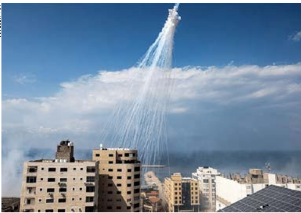
Bombardio criminoso das forças de Israel com armas banidas é noticiado pelo NYT