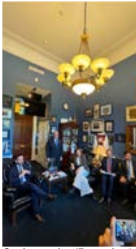
Os deputados (Reprodução)

A parlamentar Sydney Kamlager-Doyle, que é copresidente da Bancada do Brasil (Brazil Caucus), disse que “se bancos dos EUA estiverem de alguma forma envolvidos em algo ilegal ou impróprio, o povo americano e o brasileiro precisam saber”.