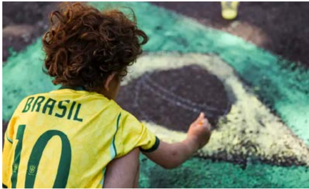
Moradores de Brasília se reuniram para decorar a rua para a Copa do Mundo

Enquanto a bola ainda não rola, ruas coloridas, bandeiras tremulando nas janelas e mutirões comunitários demonstram que, para muitos brasileiros, a Copa do Mundo continua sendo um momento de confraternização e pertencimento. Em meio à expectativa pelo tão sonhado hexacampeonato, a competição volta a reunir vizinhos, famílias e amigos em torno de uma tradição que resiste ao tempo e mantém vivo um dos símbolos mais marcantes da cultura popular