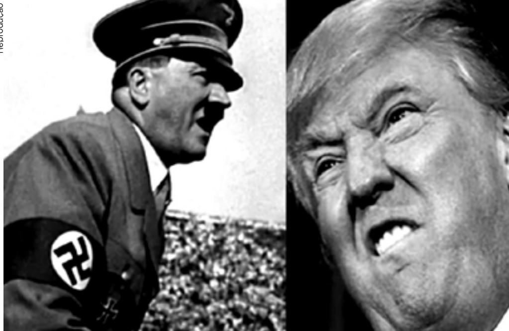
Hitler e Trump, dois fascistas que não podiam sediar jogos internacionais