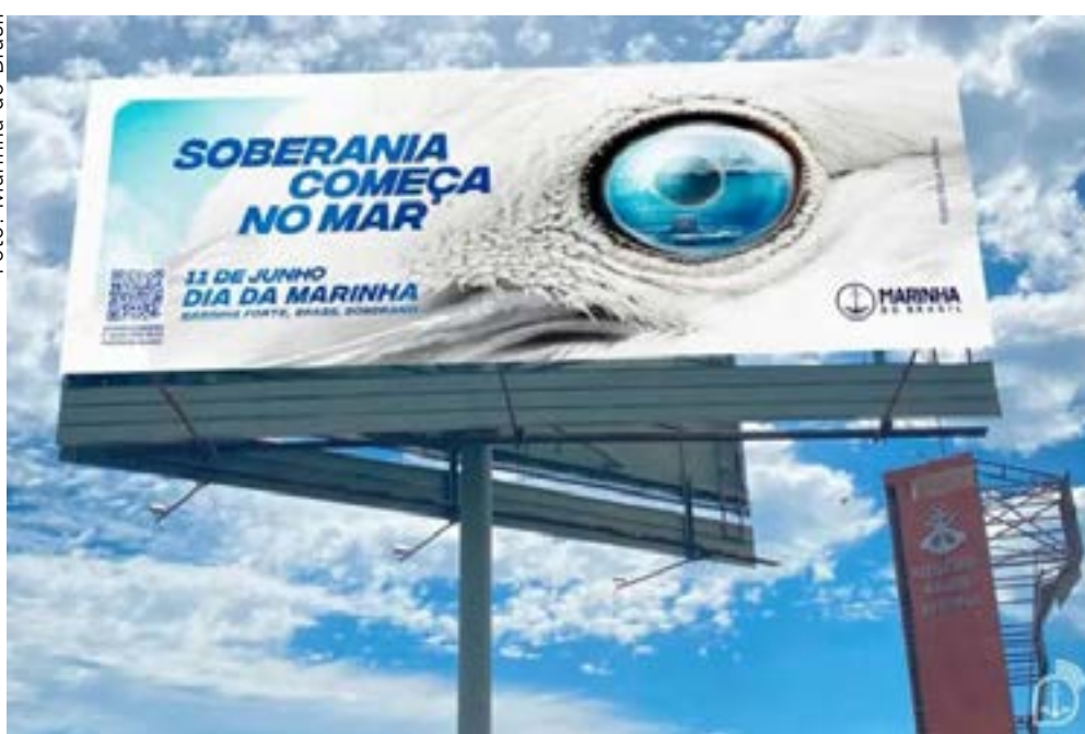
Marinha destaca defesa da Amazônia Azul e das riquezas naturais