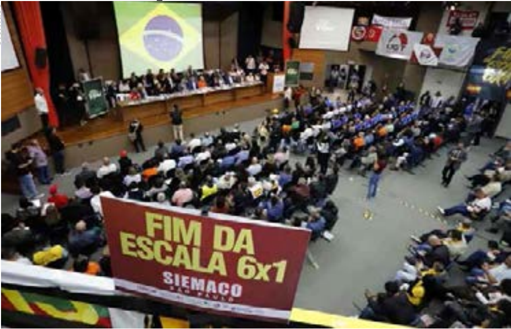
Plenária Nacional das Centrais Sindicais que definiu agenda de mobilizações

O relator, Luís Roberto Barroso, acompanhado por Gilmar Mendes, Alexandre de Moraes, Cristiano Zanin e Luiz Fux, votou pela constitucionalidade da mudança. Mas a posição foi vencida pelos votos de Edson Fachin e Rosa Weber, que defenderam a derrubada da idade mínima para a aposentadoria especial. Com posições intermediárias, mas também contrários à nova regra, André Mendonça, Nunes Marques, Dias Toffoli e Cármen Lúcia formaram maioria pela inconstitucionalidade.