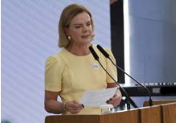
Deputada e ex-ministra Gleisi Hoffmann