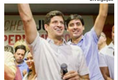
Pré-candidato ao governo de PE

A oficialização da chapa ocorre em um momento em que as pesquisas eleitorais apontam vantagem para Tarcísio de Freitas na corrida pelo governo estadual. Levantamento divulgado recentemente pelo Paraná Pesquisas indicou o atual governador à frente das intenções de voto, enquanto Haddad aparece como principal adversário na disputa.