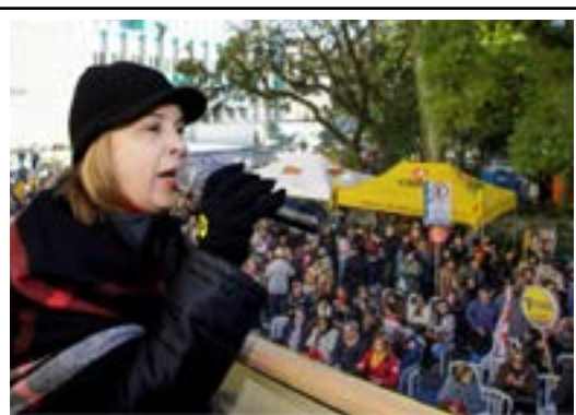
Manifestação ocupou frente da sede do Governo do Estado