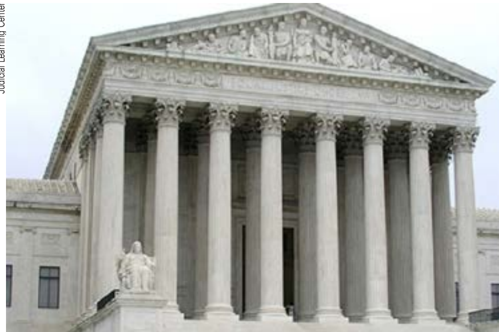
Suprema Corte dos EUA declara ilegal a xenofobia de Trump