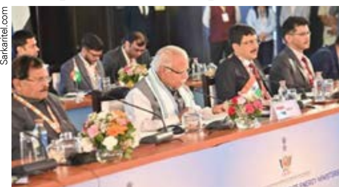
Índia recebe o encontro do BRICS sobre energia

Segundo Trump, é preocupante que “numerosos” países europeus estejam discutindo a “implementação iminente” deste imposto, e que alguns deles se encontrem “perto” de colocar isso em prática.