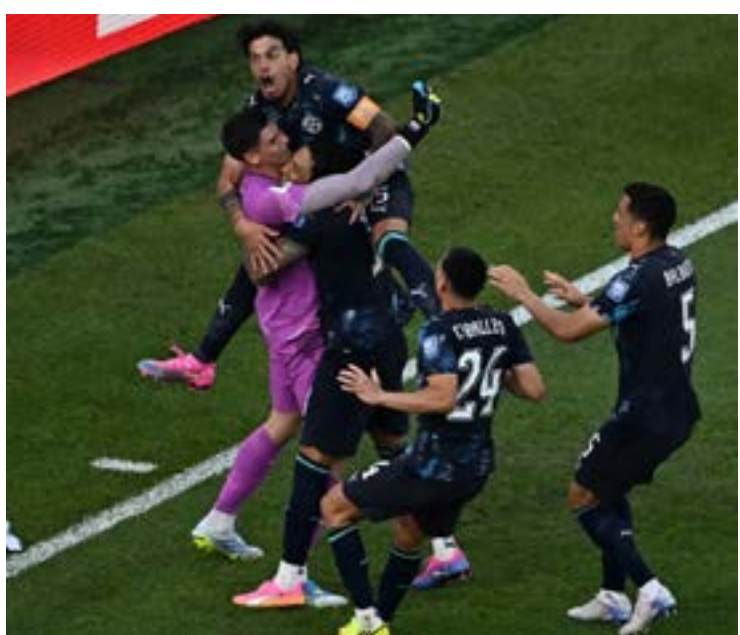
Seleção paraguaia comemora a vitória contra alemães

A eliminação representa uma grande decepção para a Alemanha, que iniciou a Copa entre as candidatas ao título, mas não conseguiu confirmar o favoritismo no primeiro confronto eliminatório. O resultado também aumenta a lista de zebras desta edição do Mundial, marcada pelo equilíbrio entre seleções de diferentes continentes.