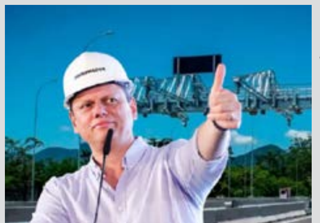
Número de pedágios se multiplica em São Paulo

O reajuste dos pedágios foi aprovado pela Agência de Transporte do Estado de São Paulo (Artesp) e também atinge outras rodovias concedidas no estado de São Paulo.