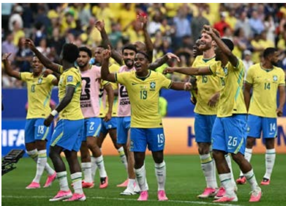
Seleção brasileira comemorou a classificação para as oitavas de final