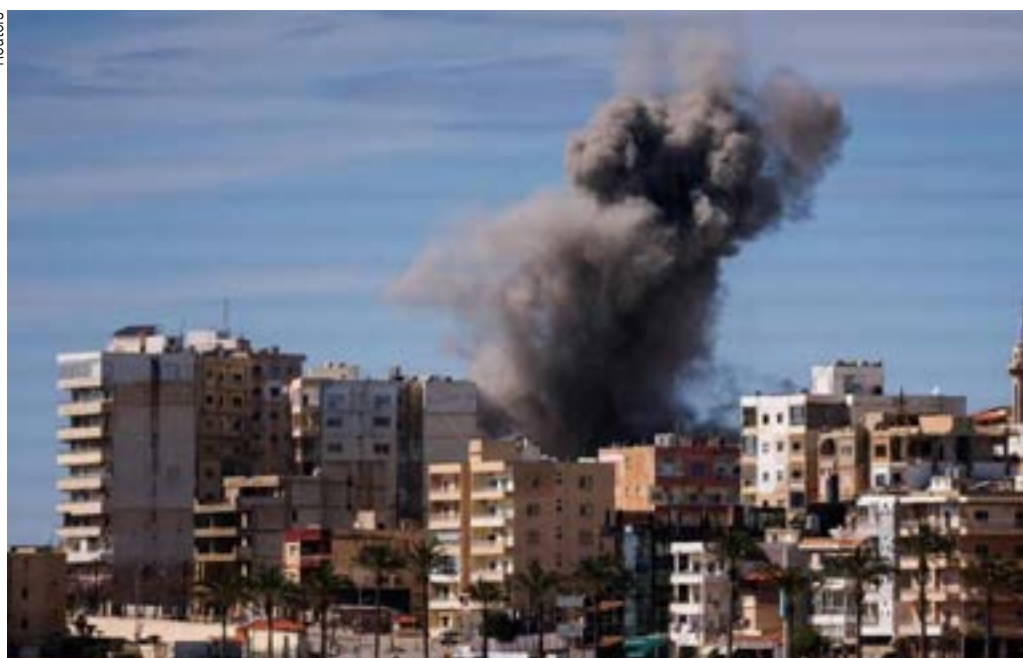
Irã respondeu a ataques de Trump com retaliação a alvos dos EUA no Kuwait e no Bahrein