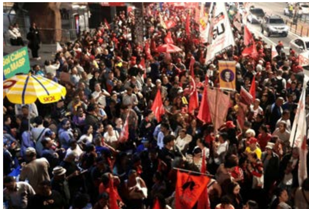
Ato pelo fim da escala 6x1, na Av. Paulista.