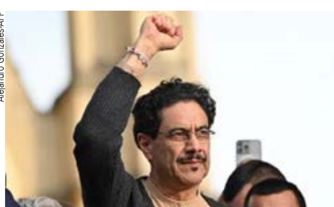
‘Cidadania americana é incompatível com Presidência’

“Se essas condições de legalidade não forem atendidas, como líder da oposição e como candidato que obteve mais de 12,7 milhões de votos na eleição de 21 de junho, não me submeterei a esta violação da nossa soberania