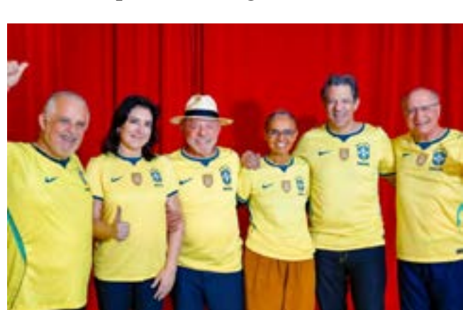
Lula junto à chapa das eleições de São Paulo

Durante o lançamento da chapa, Haddad também apresentou as principais diretrizes de sua campanha e afirmou que a segurança pública será uma das prioridades centrais de seu programa de governo. O petista