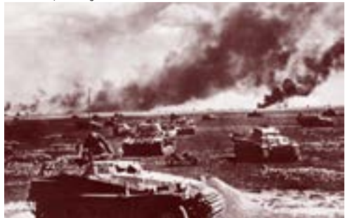
Em 22 de junho de 1941, Hitler invade a URSS