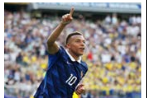
Pré-candidato ao governo de PE

Essa provocação dá sequência à polêmica envolvendo Balogun. Expulso contra a Bósnia e Herzegovina, o atacante dos EUA teve cartão vermelho suspenso – e o processo teve envolvimento do presidente americano Donald Trump, que ligou para Gianni Infantino e pediu uma revisão.