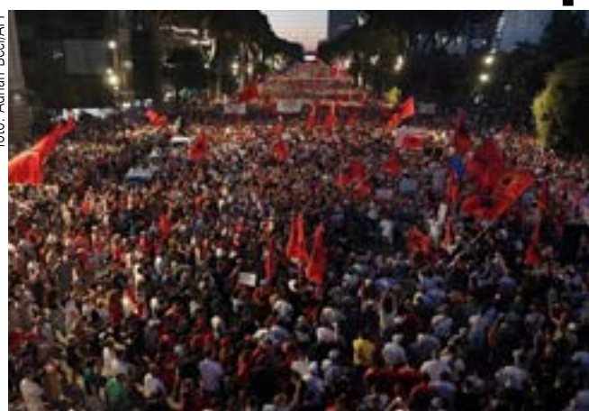
Multidão em Tirana repudia projeto de resort de Ivanka

O Comitê de Helsinque da Albânia (CHA), uma ONG de direitos humanos com sede em Tirana, denunciou que a polícia local reprimiu com violência uma manifestação em frente ao Parlamento Nacional da Albânia, na quinta-feira (2). Cerca de 20 manifestantes foram detidos.