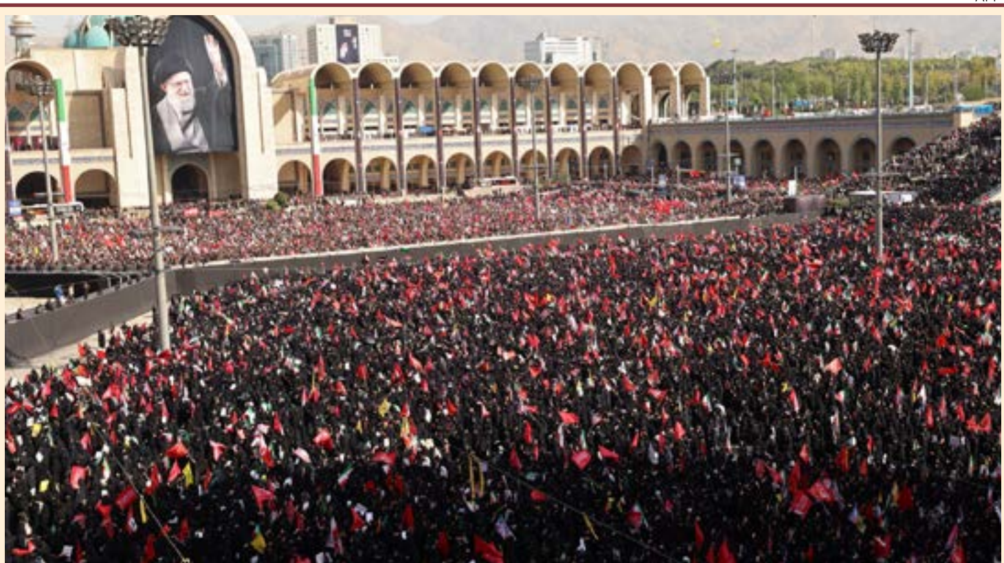
Com bandeira do Irã e fotos do líder da Revolução, assassinado por EUA e Israel, multidão tomou as ruas

O Banco do Brasil (BB) divulgou na terça-feira (8) que firmou um contrato de R$ 2,307 bilhões com a Empresa Brasileira de Correios e Telégrafos (Correios) para a prestação, por cinco anos, de serviços postais convencionais, especiais e telemáticos, em âmbito nacional e internacional. A importante parceria levou em conta que, fora dos Correios, “não existem prestadores com capilaridade e capacidade operacional equivalentes”. Página 2