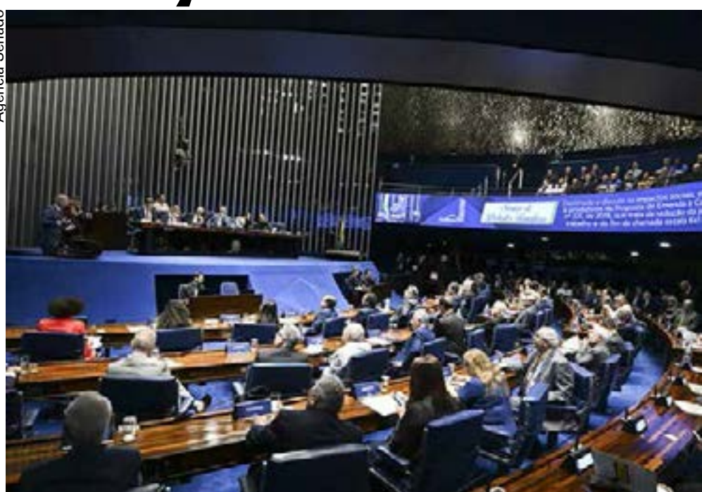
Audiência pública reuniu parlamentares, centrais sindicais e entidades

Em nota a governadora de Pernambuco, Raquel Lyra, também lamentou a partida. “Em reconhecimento a sua vida pública dedicada ao nosso estado, o Governo de PE decretará luto oficial por três dias. Que Deus console o coração da sua esposa, a ministra Luciana Santos, seus filhos, inúmeros amigos, seu time e todos os pernambucanos que lamentam sua partida”.