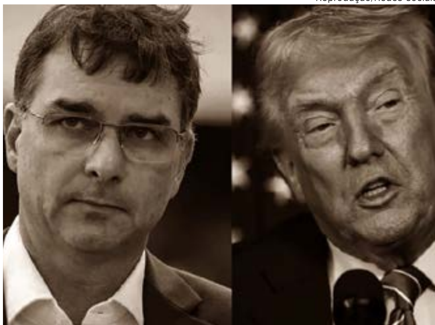
Flávio agiu como traidor da pátria, a favor de Trump, denuncia o governo brasileiro

Em março, o STF estabeleceu novo regime para disciplinar as verbas indenizatórias pagas à magistratura e ao Ministério Público.