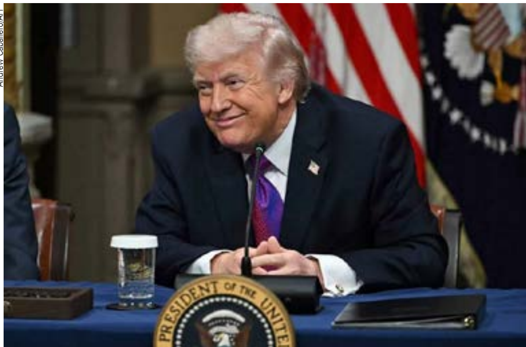
Para a senadora Elizabeth Warren, o caso de Trump é de “corrupção criptográfica”