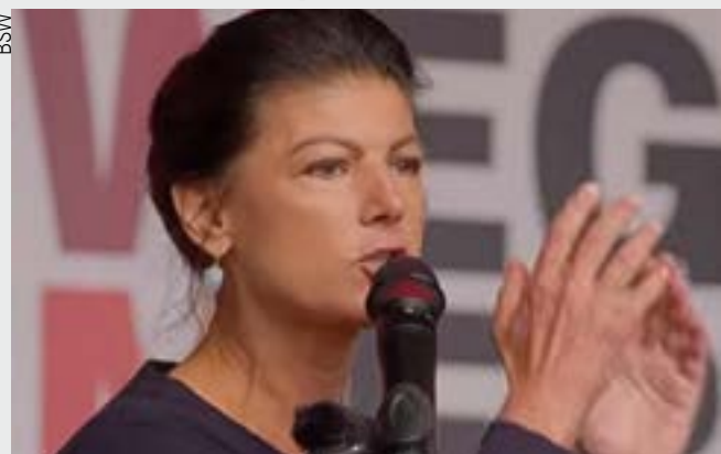
“Centenas de milhares de empregos são destruídos”

Em março milhares de estudantes do ensino médio saíram às ruas de Berlim para protestar contra a corrida ar-