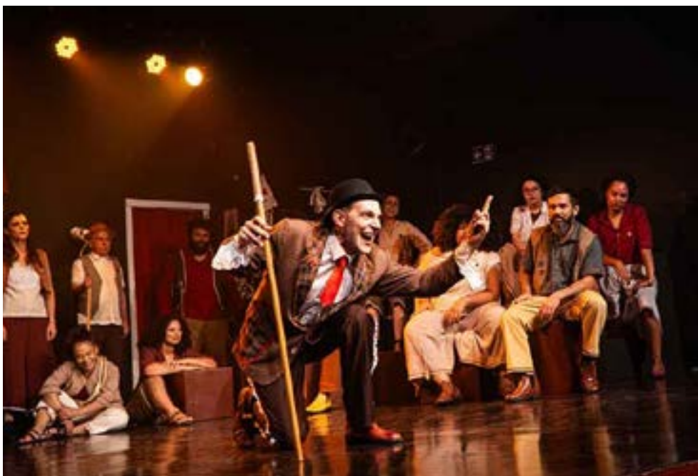
Montagem do CPC da UMES combina elementos do teatro épico, do teatro de revista e de variadas manifestações populares brasileiras