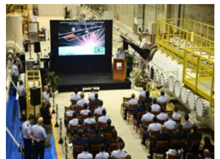
Cerimônia do lançamento.

Leia mais: https://horadopovo.com.br/vamos-superar-a-dependencia-e-transformar-nossos-recursos-minerais-em-beneficio-do-pais-defende-ministra/