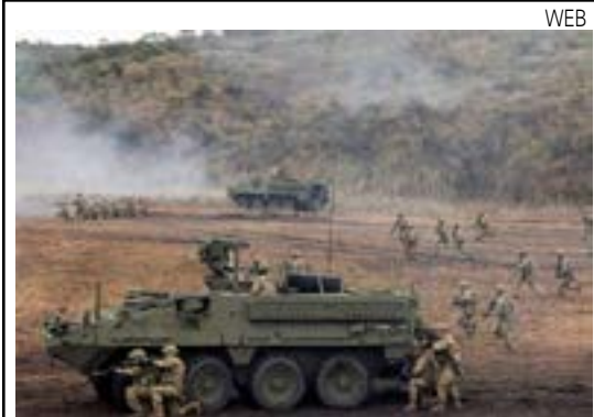
Tropas dos EUA comandando argentinas