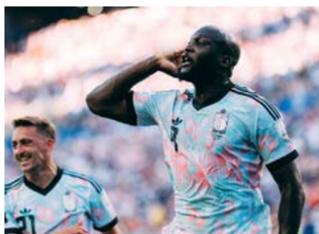
Atacante belga fez o quarto gol da equipe

Na comemoração, Lukaku correu com as mãos nas orelhas, xingou, se juntou ao restante do banco da Bélgica na bandeira de escanteio e dançou de uma maneira que, nas redes sociais, levantou comparações com a dancinha de Trump. Depois, ergueu uma camisa com o número 24, de Onana, que nem se-