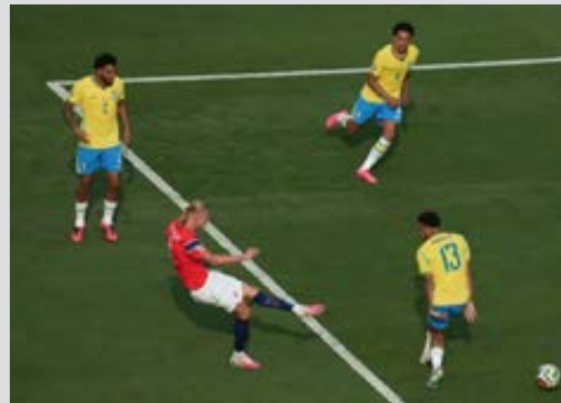
Defesa brasileira vê Haaland sozinho marcar o gol

ruaguês, aproveitou as duas únicas oportunidades em que ficou sozinho para marcar. Primeiro, aos 34 minutos do segundo tempo, com um gol de cabeça, em que pulou sozinho entre os zagueiros brasileiros. Já no fim da partida, recebeu uma bola, também sozinho e chutou no meio das pernas do lateral Danilo. Não dando chances para o goleiro Alisson defender.