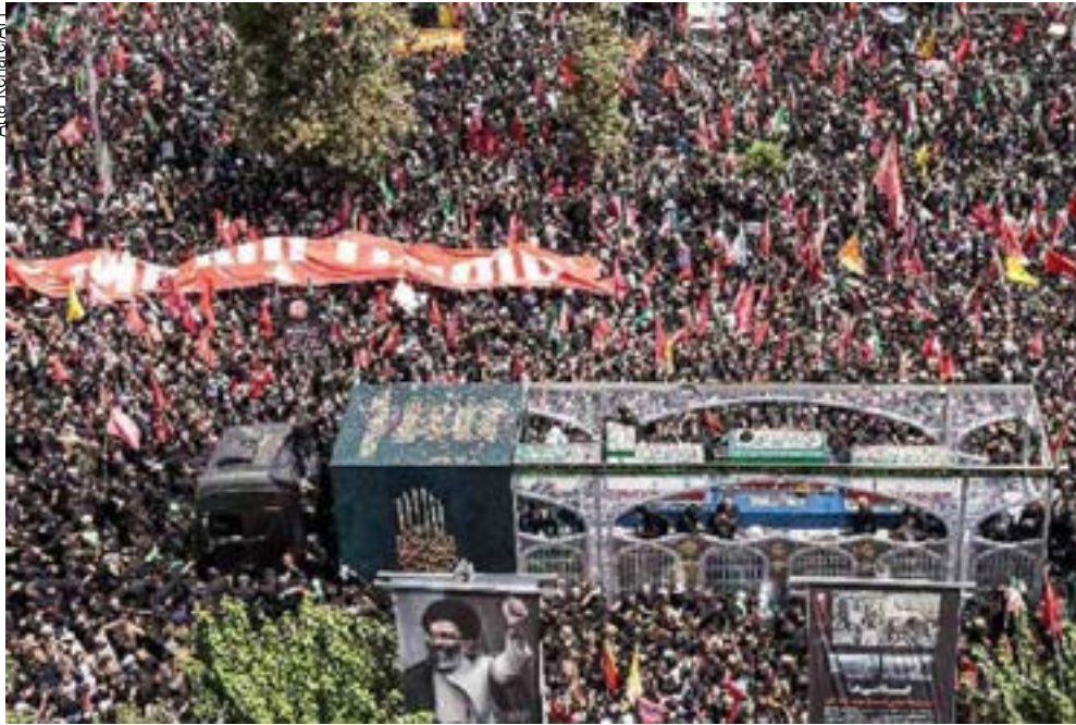
Funerais do líder assassinado lotam as ruas iranianas