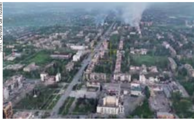
Konstantinovka está livre do regime nazi de Zelensky

A perda da cidade enfraquece significativamente a logística e o suprimento das forças ucranianas em toda a zona de combate da frente oriental. Por servir como corredor logístico e